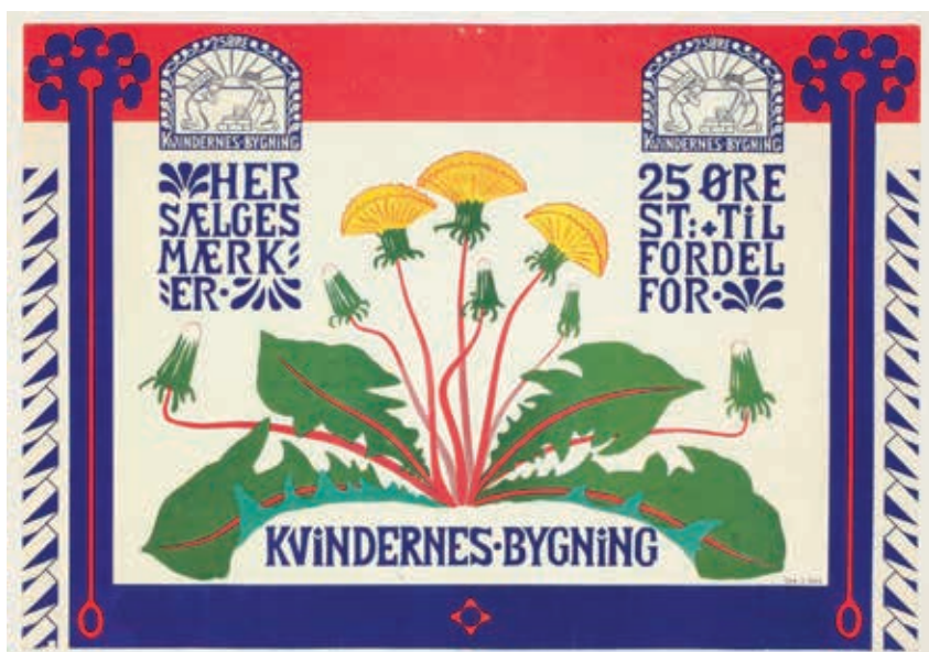
Susette Holtens gadeplakat for indsamlingen til den kommende Kvindernes Bygning.

To samarbejdende kunstnere stod bag skabelsen af vægtæppet: maleren Ebba Carstensen (1885-1967) tegnede kartonen og maleren Astrid Holm (1876-1937) udførte vævearbejdet.