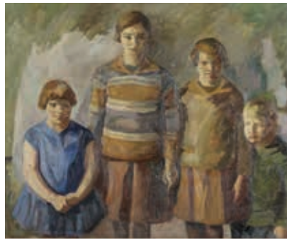
Elisabeth Neckelmann, Portræt af fire børn, udateret, 116x132 cm.