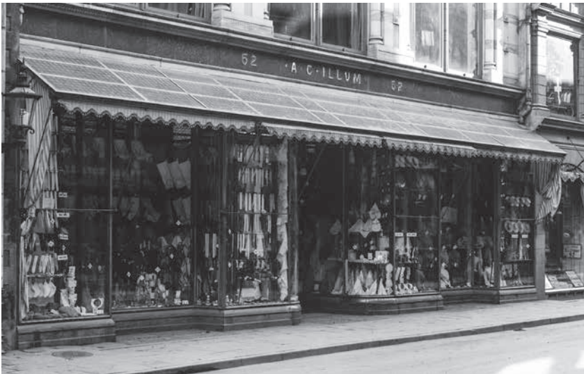
A.C. Illum, Østergade 52, udateret.

„Den, der har Evner, Lyst og Kræfter, skal bruge dem stærkt. Det er Vedkommendes Ret og Pligt. Og for Hjemmene er det af allerstørste Betydning, at Moderen er saa højt aandeligt udviklet som muligt. Hvorledes skal hun ellers være i Stand til at gaa ind paa de Unges Tankegang og endnu mindre til at lede dem,“ spurgte hun retorisk.