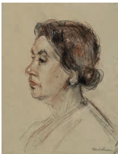
Bodil Begtrup tegnet af Karl Larsen. Tegningen hænger i Kvindernes Bygning.

Senere da hun skulle udnævnes til internationale positioner, kom det op i regeringen, om man kunne sende en fraskilt kvinde ud som højtstående delegat fra Danmark. Men heldigvis besindede den daværende regering sig, og Bodil Begtrup fik et langt internationalt virke.