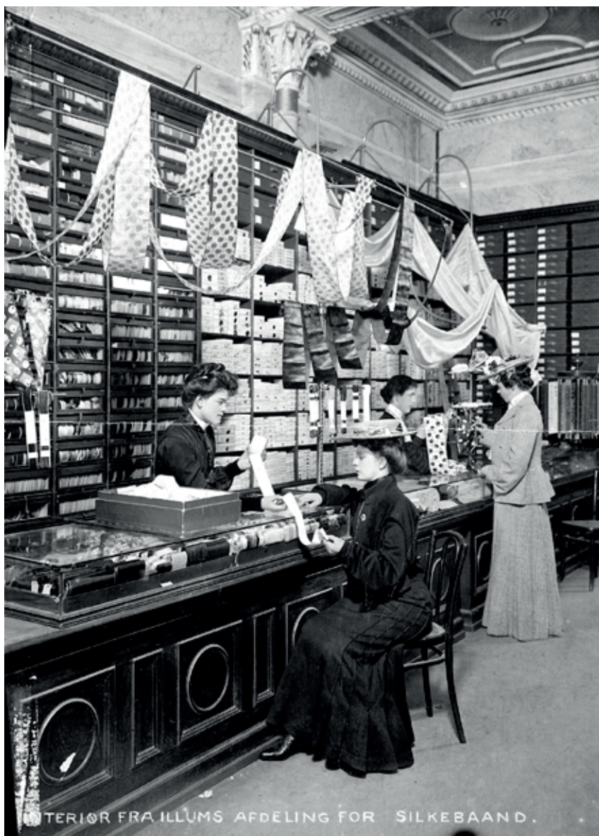
Illum var fra begyndelsen en kvindearbejdsplads med kontorister til papirarbejdet og ekspeditricer til at betjene kunderne, der ikke skulle besvære sig med at stå op, mens de ventede på at få fremvist varerne i en tid uden selvbetjening, 1904.

"Hegnet" - Den under dette Navn af "Kvindernes Bygning" startede Forening, hvis Formaal det er at skabe et hyggeligt Tilflugtssted for kvindelige Kontorister efter Dagens anstrengende Arbejder, aabnede iaftes sine forløbige Lokaler, som er installerede i A. Schmidts Realskole i Store Kongensgade. Skjøndt det paa Forhaand maatte anses for vanskeligt, næsten uoverkommeligt at skabe Hygge i Rum, som om Dagen benyttes til Skolebrug, er dette dog fuldt ud lykkedes den energiske Bestyrelse for "Kvindernes Bygning". Skolens rummelige Gymnastiksal er ved faa Midler gjort til et behageligt Opholdssted, som sikkert ikke vil undlade at øve sin Tiltrækning. I Forbindelse dermed staar nogle mindre Klasseværelser, som benyttes til Toilet, Kjøkken osv. Indvielsen iaftes overværedes af en talrig Kreds af Damer. Festtalen holdtes af Fru Emma Gad, som tolkede det almindelige Ønske om, at Foreningen maatte blive, hvad den tilsigtede: Et Hegn for enligt stillede Kvinder."