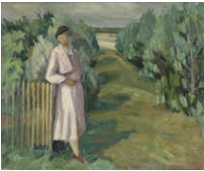
Elisabeth Neckelmann, Kvindeskikkelse ved hegn, udateret, 85x104 cm.