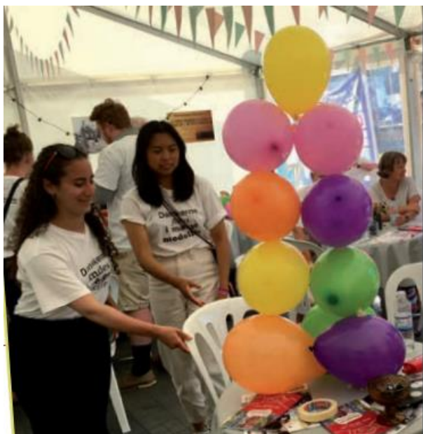
"Det er sjovt at samarbejde"