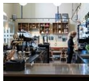
Cafe August B

Kl. 16.00 Mulighed for kaffe i Cafe August B for egen regning.