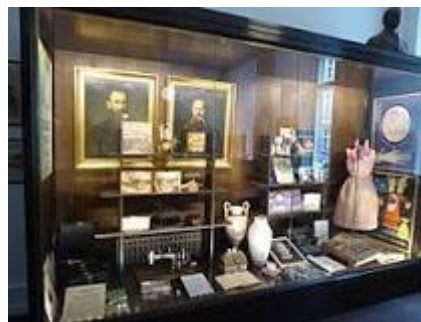
Magasin du Nord Museum

Kl. 13.50 Mødes ved Magasin du Nord Museum på Vingårdstræde 6 og derefter guidet rundvisning.