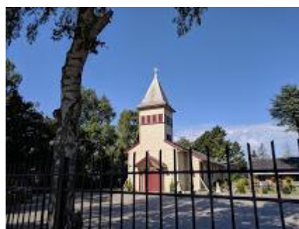
Skt. Maria & Skt. Markus

Det andet arrangement er torsdag den 5. september 2019 , 17.00 med besøg i "Den Koptiske Ortodokse kirke", Taastrup Hovedgade 162, 2630 Taastrup