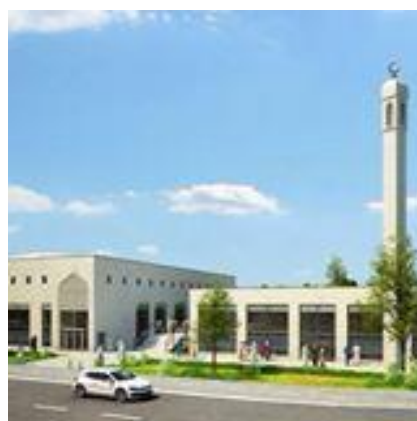
Hamad Bin Khalifa Civilisation Center - Moské

Det sidste arrangement er planlagt til torsdag den 10. oktober 2019 , kl. 12.00 (datoen er ikke bekræftet) med besøg i Moskeen i Rovsinggade, Vingelodden 1, 2200 København N.