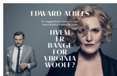
Forestilling i Skuespilhuset

Kl. 20.00 Forpremiere i Skuespilhuset på forestillingen "Hvem er bange for Virginia Woolf"; for egen regning.