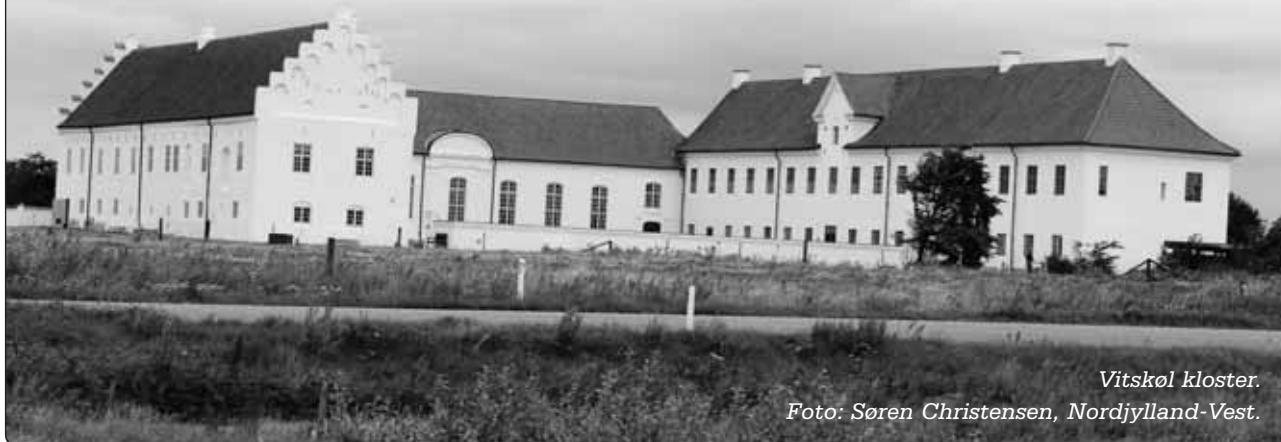
Vitskøl kloster.