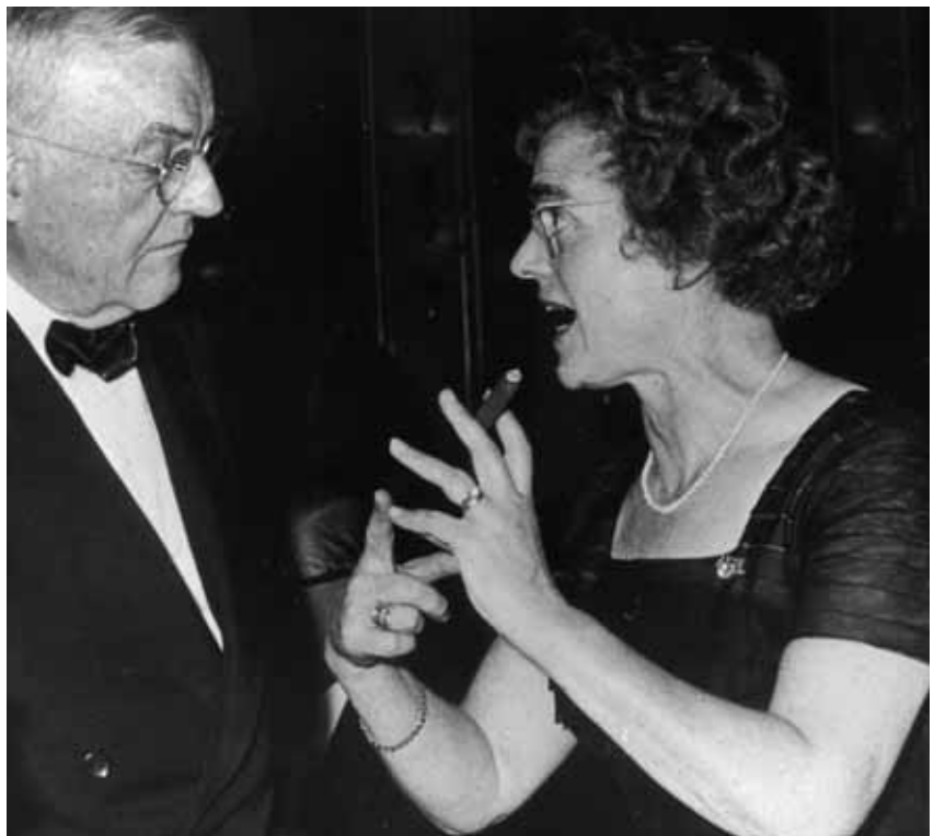
Den berømte situation, hvor den danske minister og initiativtager til Folkevirke, Bodil Koch står i engageret samtale med den amerikanske udenrigsminister John Foster Dolles

Uden at svare her vil jeg blot minde om, at der for en generation siden fandtes politikere og ministre i dansk politik, der havde mod til at lede det folk, de var valgt af. Der vovede at gå imod strømmen. Én af disse var Bodil Koch, der var Danmarks tredje kvindelige mini-