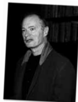
Kunstneren Per Kirkeby.

Den bliver gennemført i dagene den 15. – 19. maj 2006 og med base i »Sanden Bjerggård« ved Slettestrand. Ved planlægningen af turen er der lagt vægt på at komme hen til steder, som man ikke umiddelbart selv finder hen til – og samtidig også vise nogle af de naturskønne områder.