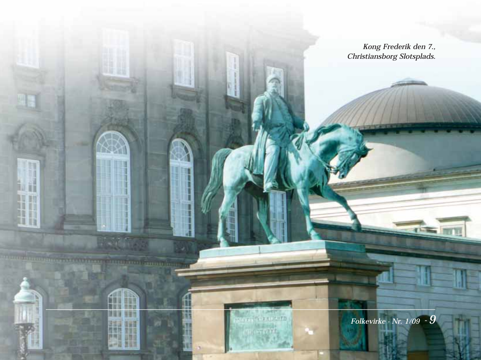
Kong Frederik den 7., Christiansborg Slotsplads.

Til slut kan det dog være nyttigt også at minde om, at nationalismen aldrig har været enerådende. Ikke alene har den altid sameksisteret med en mængde andre fællesskabsidentiteter. Den har også skabt politiske modbevægelser. De kontraster mellem en etnisk nationalisme og politiske fordringer på tværs af landegrænser, som er opstået gennem nationalismens udvikling, har således løbende fremkaldt kritik og udfordring fra forskellige internationalistiske, kosmopolitiske og anti-nationalistiske strømninger – bl.a. i arbejderbevægelsen. Så selv om nationalismen er markant, er den altså ikke enerådende.