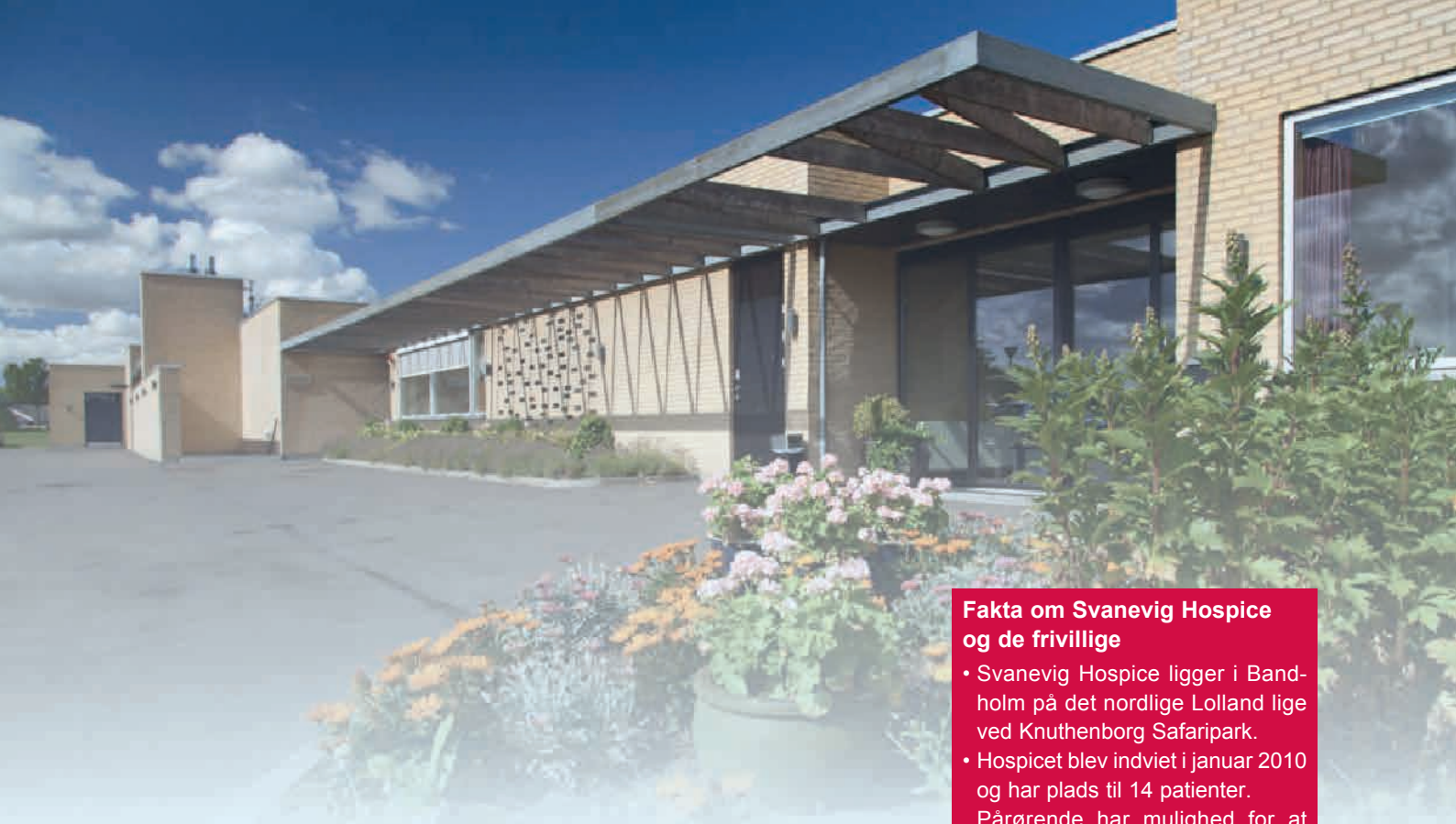
Svanevig Hospice ligger i naturskønne omgivelser i Bandholm på det nordlige Lolland lige ved Knuthenborg Safaripark.