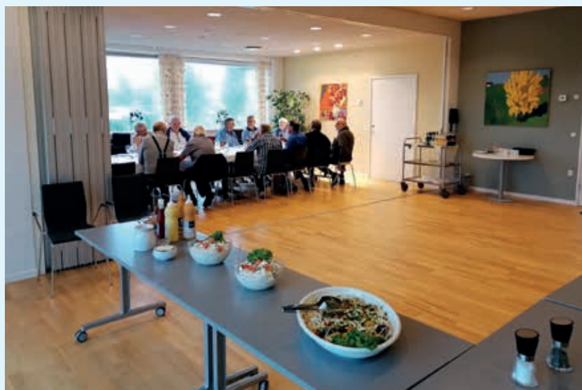
Der er altid god tilslutning til fællesskabet i spiseklubberne, hvor spisning og hyggeligt samvær går hånd i hånd.

- Det er både inspirerende og livsbekræftende at lytte til deres op-