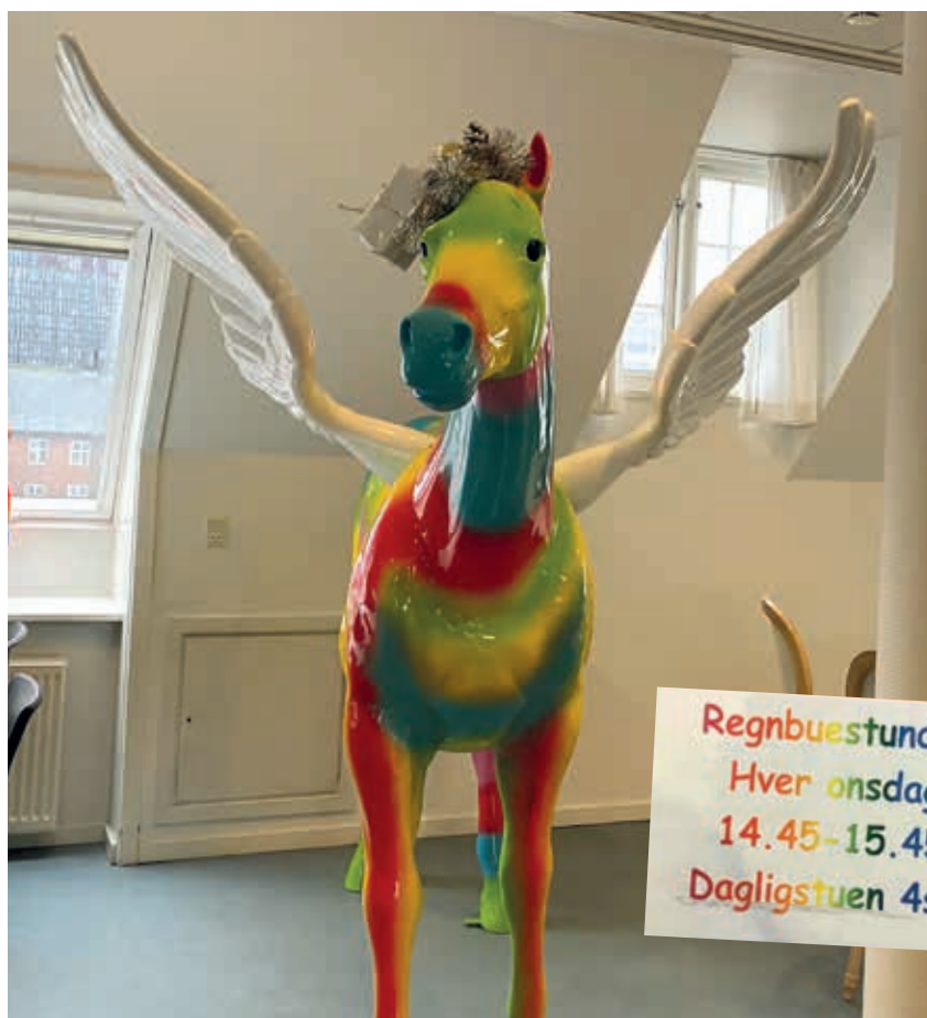
På "Slottet" er det vigtigt, at der er en levende indretning – og at huset emmer af liv. Derfor blev denne særlige pegasus-hest købt til at stå i "Slottets" dagligstue.