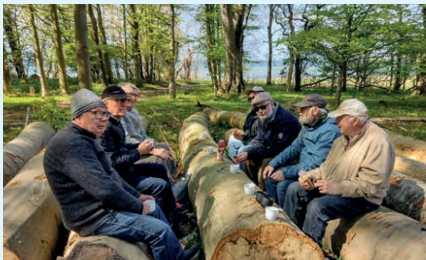
Et glimt fra en hyggestund på en tur i mændenes vandrekлуб.

- Vi læste for eksempel en artikel om det at miste, som gav en god snak. Den løsnede især noget op for én af kvinderne, som ellers ikke syntes, hun havde noget at fortælle.