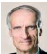
Af fhv. minister Bertel Haarder

Det var Øresundgruppen, der inviterede mig til Almedals-uge i Visby på Gotland – Byen, som kong Valdemar Atterdag plyndrede på det groveste. Hans hær slog en bondehær – dræbte 1800 ud af 2000 – men lovede at skåne byen, hvis tre store kar blev fyldt med guld og sølv. Hvorefter han brød løftet og plyndrede den. Alligevel lykkedes det hans datter Margrethe den Første at forene Norden i Kalmarunionen ved snilde og list.