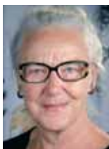
Af fhv. kulturminister Jytte Hilden