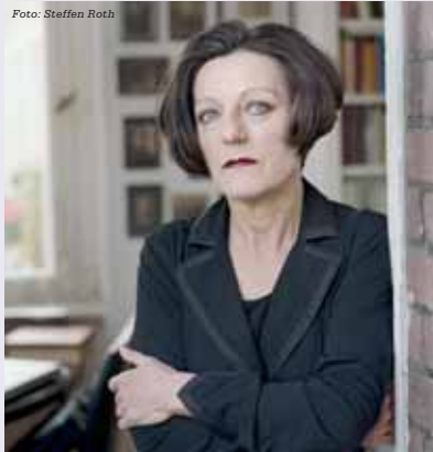
Den rumænsk-tyske forfatter Herta Müller.

Og 20 år senere boede jeg for længst alene i byen og var oversæt-ter på en maskinfabrik. Klokken fem om morgenen stod jeg op, halv syv begyndte arbejdet. Om morgenen gjaldede nationalsangen fra højttaleren ud over fabriksgården. I middagspausen arbejderkorene. Men arbejderne, der sad og spiste, havde tomme øjne som hvidblik, olietilsølede hænder, deres mad var pakket ind i avispapir. Inden de spiste deres lille stykke flæsk, skrabe de tryksværtten af med kni-ven. To år gik der i dagligdagens luntetrav, den ene dag lignede den anden.