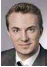
Af Morten Messerschmidt (DF), cand.jur., MEP

Identiteter er et af tidens »hott« begreber. I takt med globaliseringen er spørgsmålet om identitet blevet mere aktuelt end nogensinde, og meningene er delte, når det kommer til begreber som identitetsdannelse og for den sags skyld nationalstatens rolle og »fortælling« (et andet modebegreb).