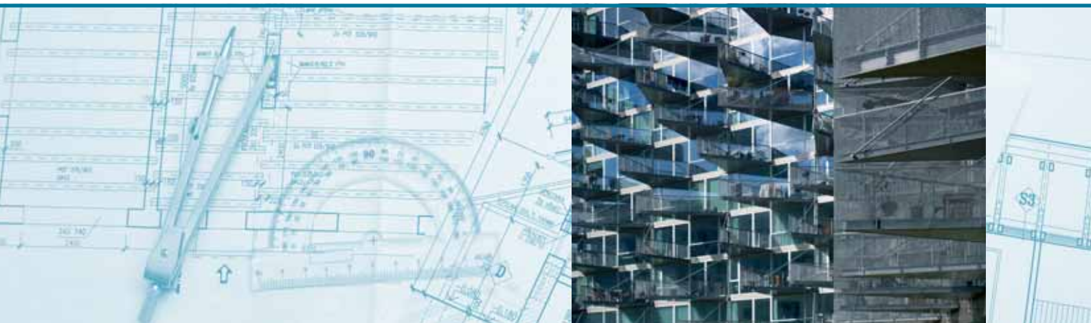
Arkitekt Bjarke Ingels har bl.a. slået stregerne til VM Husene i Ørestaden.