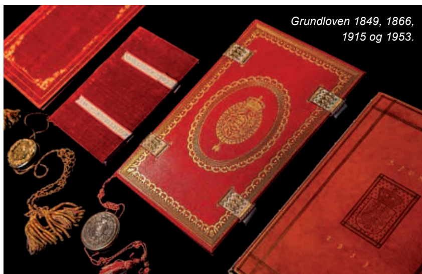
Grundloven 1849, 1866, 1915 og 1953.

cracy and promote its proper func- tioning« (Platform for Action, art. 183). Trods de mange fremskridt er kvin- der stadig underrepræsenterede på den politiske arena over hele ver- den. Kun omkring en fjerdedel af pladserne i verdens parlamenter indehaves af kvinder, og kun ca. 20 pct. af alle verdens ministre er kvin- der. Ifølge FN's nye holdbarheds- mål skal inden 2030: »Kvinder skal