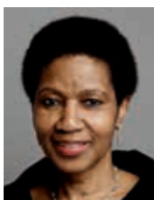
Af Phumzile Mlambo-Ngcuka, vicegeneralsekretær i FN og general- direktør i UN Women

– og skab større sikkerhed for kvinder, der ønsker at være aktive i samfundsdebatterne