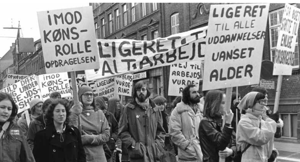
Siden ungdomsoprøret i 1968 og de følgende årtier har der været kæmpet for kvinders rettigheder – bl.a. for ligeløn og mod stereotype opfattelser af kønsroller.

Svaret er da også et JA med store bogstaver og en treleddet argumentation: