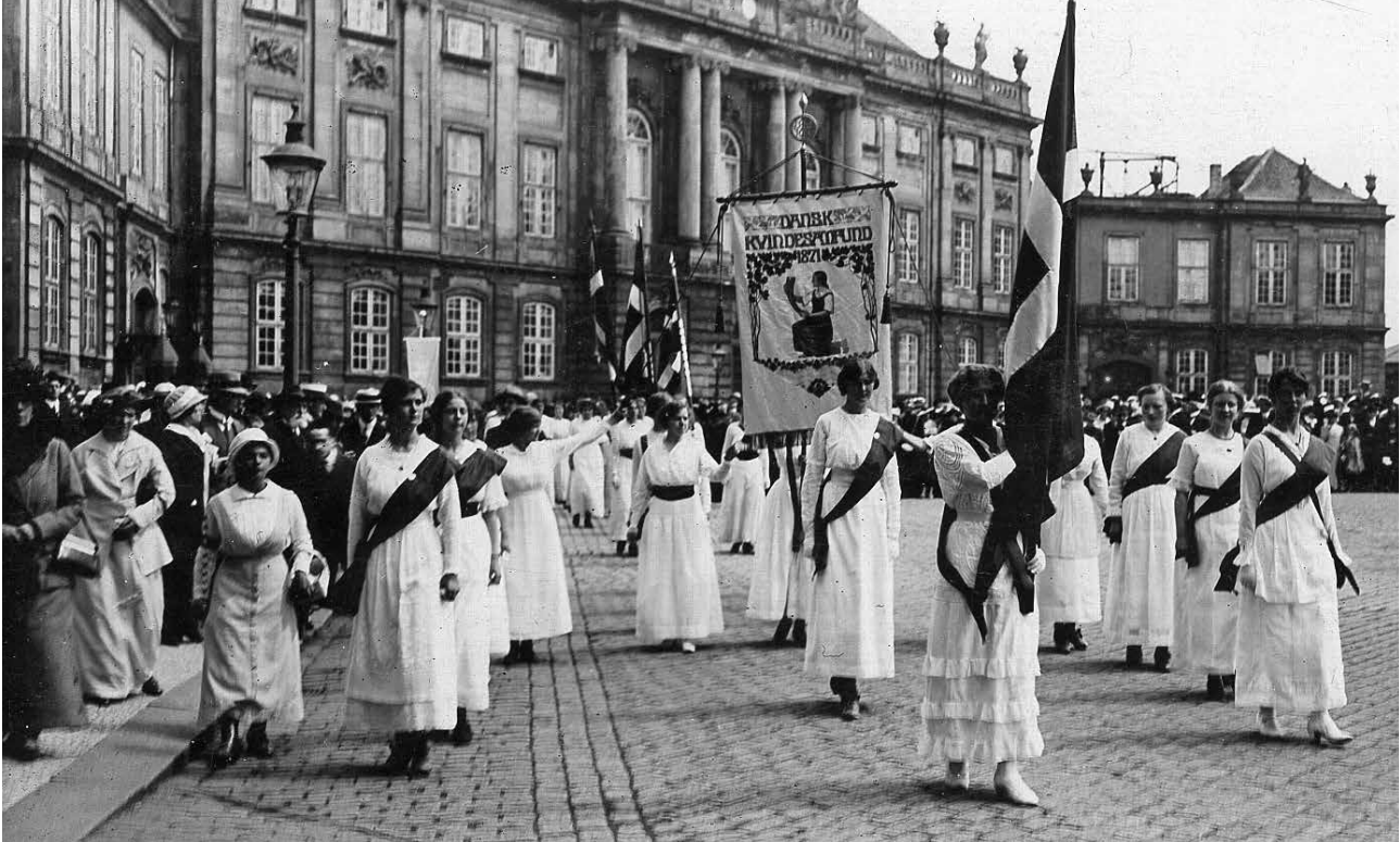
Valgretstoget i 1915 endte på Amalienborg, hvor en deputation med repræsentanter fra kvindevalgretsorganisationerne overrakte kongen en adresse, som gav udtryk for, at kvinderne nu endelig havde fået, hvad de burde have haft ret til hele tiden.