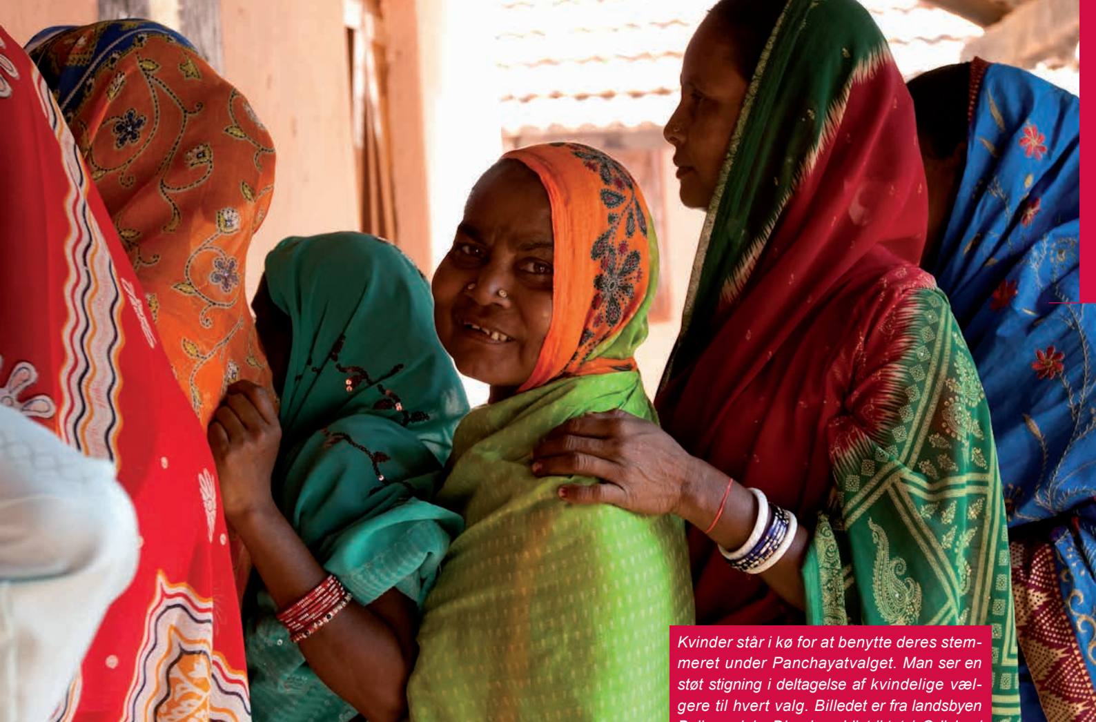
Kvinder står i kø for at benytte deres stemmeret under Panchayatvalget. Man ser en støt stigning i deltagelse af kvindelige vælgere til hvert valg. Billedet er fra landsbyen Baligarodah, Dhenkanal-distriktet i Odisha i Indien.