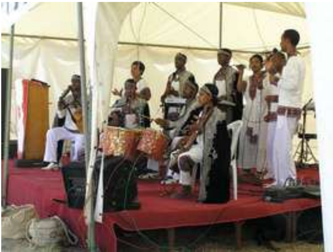
Etiopisk band med de traditionelle, etiopiske instrumenter