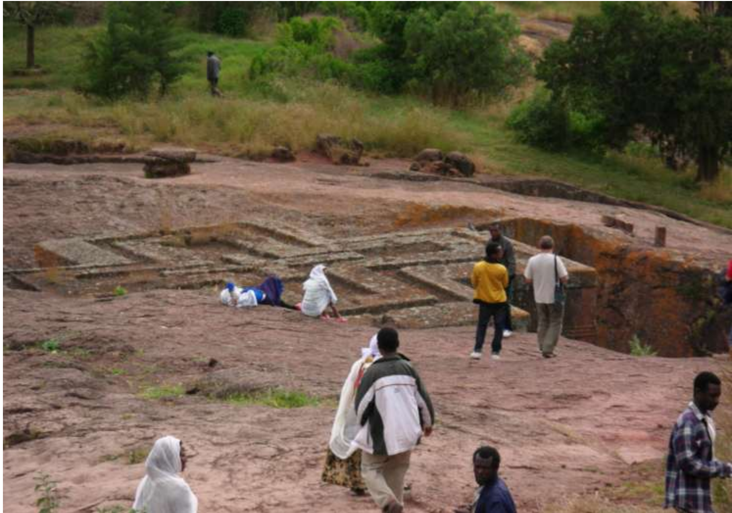
Den verdenskendte Sct. Georgkirke i Lalibela