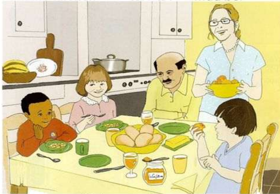
plate ሳህን sahen