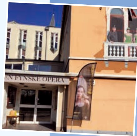
Den Fynske Opera.