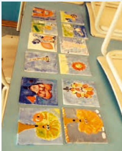
I løbet af dagene på Bedsteforældre/Børnebørn-lejren blev der tid til at hygge sig indendørs med bl.a. at tegne og male.

Børnene var i alderen 3-10 år, og de havde det dejligt sammen, gav plads til hinanden, når der var aktiviteter, og kunne i den grad lege sammen. Uden voksenindblanding lavede de underholdning til torsdag aften, og alle var med i underholdningen. Der blev også tid til at male flotte malerier, lave sjov med æbler og til at pynte muffins.