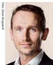
Af udenrigsminister Kristian Jensen (V)

Danmark bør være med i det fælles europæiske politisamarbejde, Europol. Vi skal bekæmpe kriminalitet ved fælles hjælp. Det tror jeg, at alle kan blive enige om. Danske politifolk skal have muligheden for at samarbejde fuldt ud med andre politifolk i Europa om at holde Danmark trygt.