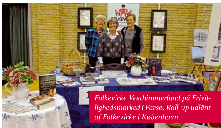
Folkevirke Vesthimmerland på Frivillighedsmarked i Farsø. Roll-up udlånt af Folkevirke i København.