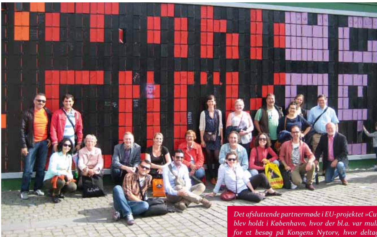
Det afsluttende partnernøde i EU-projektet »Culkas« blev holdt i København, hvor der bl.a. var mulighed for et besøg på Kongens Nytorv, hvor deltagerne skrev ordet »CULKAS« på væggen – og derefter tog dette gruppefoto.