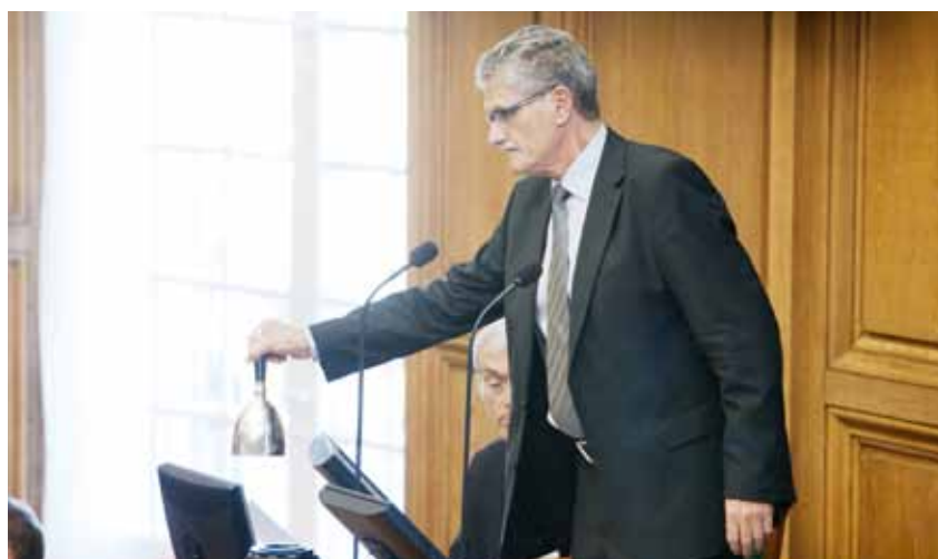
Formand for Folketinget Mogens Lykketoft: - Et velfungerende folkestyre forudsætter oplyste borgere, der har reel adgang til informationer fra alle sider.

Tyskland har 5 pct., og det betød ved seneste forbundsvalg, at De frie Demokrater – et af Forbundsrepublikkens tre gamle demokratiske partier – faldt ud af Forbundsdagen. En sådan grænse ville ved seneste valg i Danmark også have sendt De Konservative ud af Folketinget.