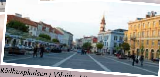
Rådhuspladsen i Vilnius, Litauen.