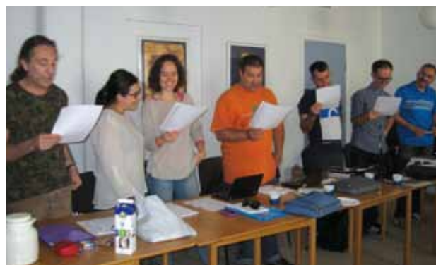
Hver mødedag blev indledt med en morgensang. Hver partner havde medbragt en sang, som alle skulle synge med på efter en kort introduktion.