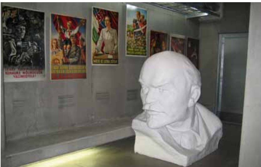
I løbet af Nordplus-projektet har deltagerne fået indblik i dagliglivet og demokratitudviklingen i de enkelte partnerlande. Her et glimt fra et besøg på Besættelsesmuseet i Tallinn med bl.a. plakater og skulpturer fra Sovjettiden.

Den solide demokratiske basis i Danmark følte vi med hver eneste skridt, vi tog der. Grundlæggende værdier, som alle bakker op om, er synlige i for eksempel den multikulturelle udvikling i landet. Vi oplevede, hvordan folk fra andre