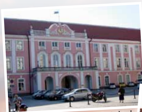
Parlamentsbygningen i Tallinn, Estland.

I Litauen fik vi fortalt om tolerance-centre. At inddrage unge mennesker i arbejdet med at respektere mennesker med en anden kulturel baggrund, som man gør det på disse centre, er en god idé, som vi godt kan lære noget af.