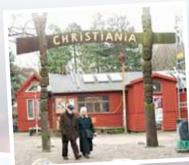
Fristaden Christiania, København.