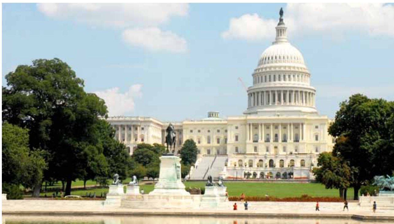
USAs tokammerssystem kan være nødvendig for at holde sammen på en frivillig sammenslutning af små og store stater, men kan også være en udfordring for den direkte valgte præsident i Det hvide Hus.

Det nationale danske kompromis fra 1953 var, at nok blev Landstinget nedlagt, men til gengæld blev der åbnet forskellige veje til, at min-