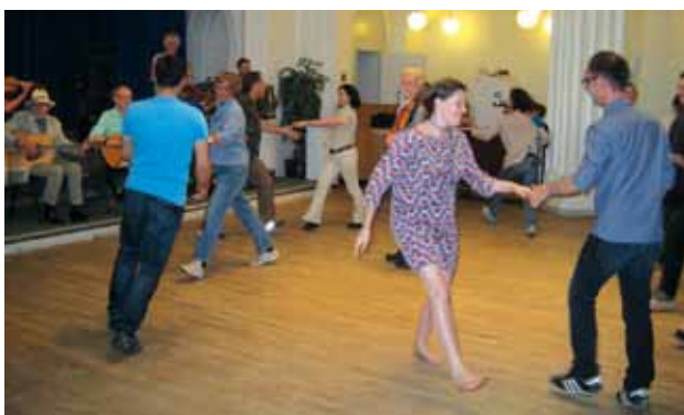
I løbet af partnerbesøget i København blev deltagerne introduceret for dansk spillemandsmusik. Gruppen »Spillefolk« spillede op til en række danske og svenske folkedanse.

Tyrkerne havde lavet en quiz. Vi skulle høre os frem til, om de spillede klassisk tyrkisk musik, arabesque, folkemusik, religiøs musik eller popmusik. De fortalte desuden om de forskellige musik-