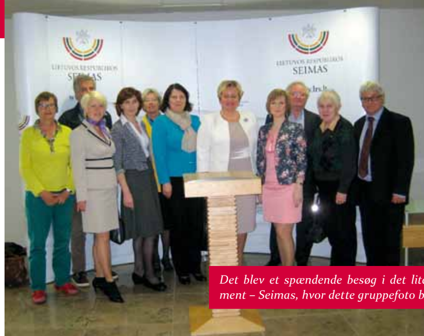
Det blev et spændende besøg i det litauiske parlament – Seimas, hvor dette gruppefoto blev taget.

Efter krigen fik de forbud mod at vende tilbage, og byen blev befolket med russere. Der er derfor et stort mindretal af russere i Estland i dag.